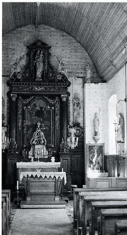
Le Thil-Ribérpré (Seine-Maritime). Église Notre-Dame de l'Assomption, vues extérieure et intérieure.

Des travaux importants de remise en état des toitures étaient nécessaires. La Sauvegarde de l'Art Français a accordé une aide de 60 000 F en 1988.