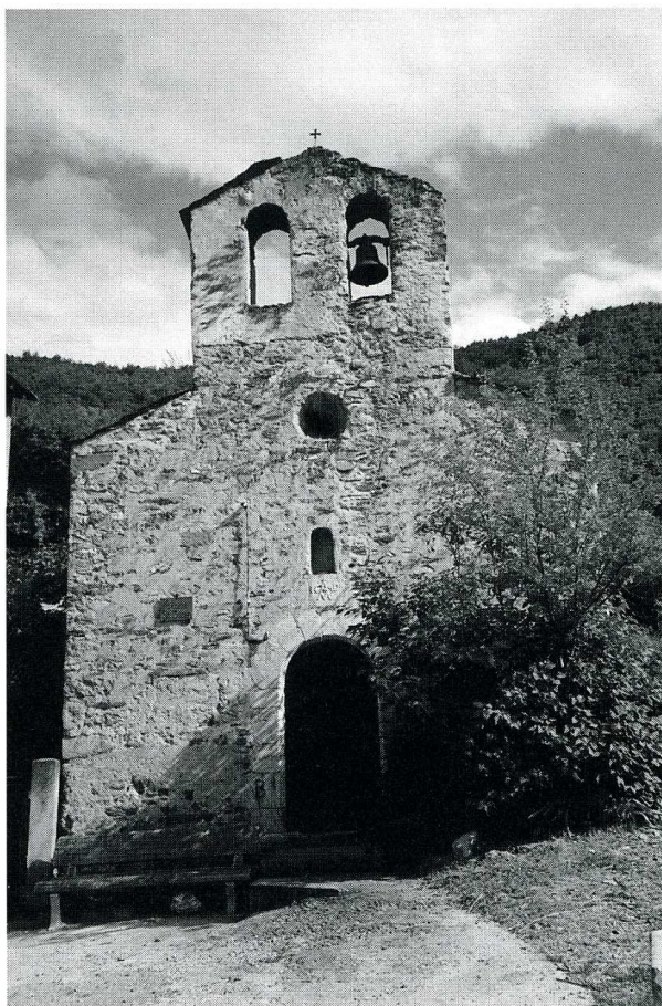
Serdinya (Pyrénées-Orientales). Eglise Saint-Jean-Baptiste de Joncet. Façade occidentale.

Pyrénées-Orientales, canton d'Olette, arrond. de Prades, 213 hab.