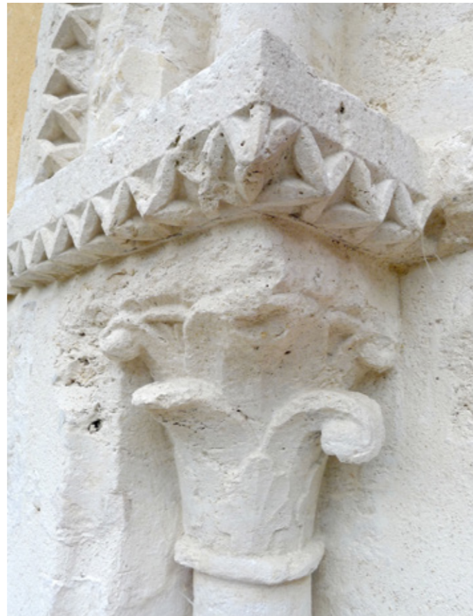
9. Chapiteau du portail ouest