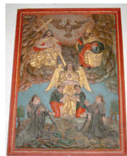
9. Panneau sculpté : la Rédemption des captifs, vers 1634