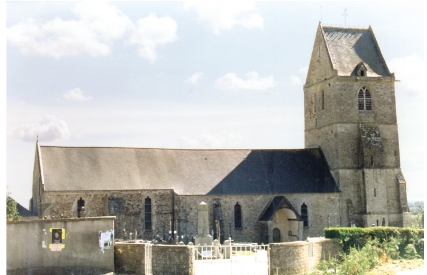
1. Façade nord

Canton Bricquebec, arrondissement Cherbourg-Octeville, 355 habitants ISMH 1985