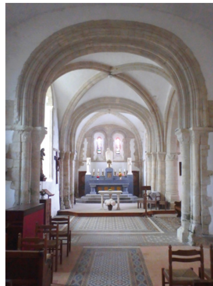
6. Vue intérieure vers le chœur roman