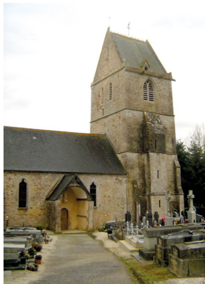
3. Clocher côté nord