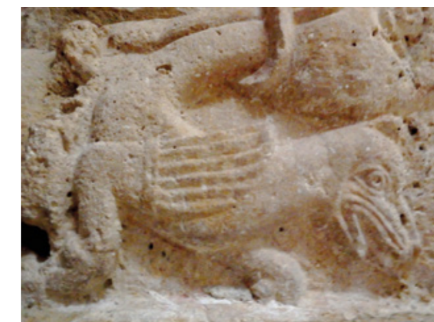
8. Chapiteau représentant un dragon