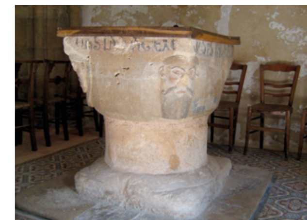
7. Fonts baptismaux romans