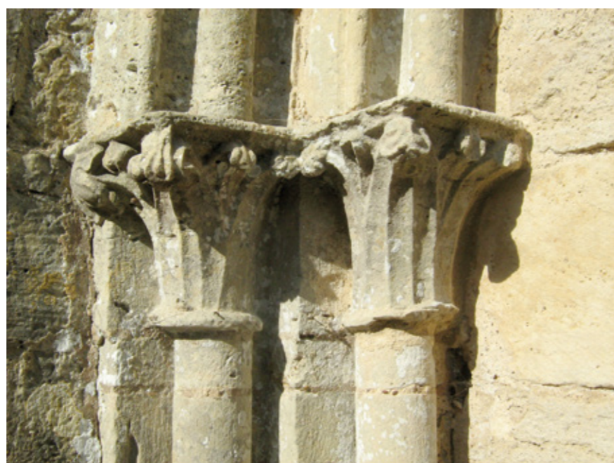
5. Détail de Chapiteaux à crochets du portail occidental

ped circulaire massif, la cuve de section carrée est ornée de têtes en haut-relief figurant les quatre fleuves du Paradis, tandis qu'une inscription court sur le bord supérieur : Totus purgatur qui sacro