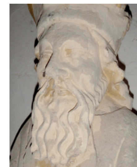
10. Statue : saint Jacques, production cotentine, fin XV e siècle

Conservation des antiquités et objets d'art de la Manche, fichier documentaire Magneville : http://objet.art.manche.fr .