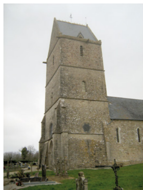
4. Clocher-porche depuis le sud-ouest