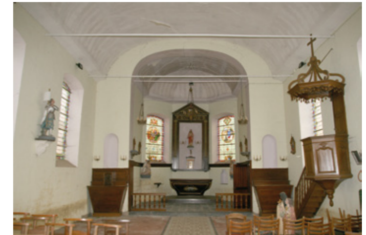
4. Vue intérieure vers le chœur