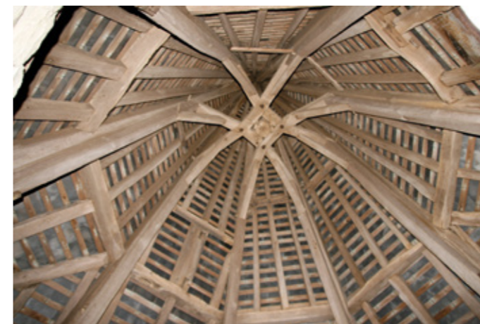
5. Charpente du clocher