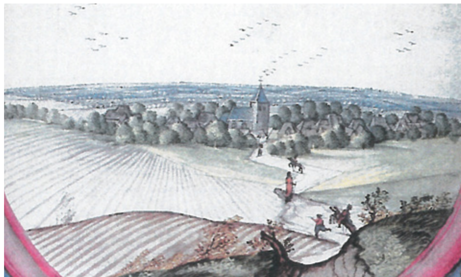
2. Album de Croÿ (gouache) : l'église de La Herlière, début XVII e siècle

L'église actuelle, très simple, a été construite en 1739 à l'initiative de Pierre-Ignace Dufour, chanoine d'Arras, dont la mère avait acquis la seigneurie une quinzaine d'années plus tôt. Elle comprend une tour-clocher de plan carré, suivie d'une large nef de trois travées, couverte d'une voûte plâtrée sur ossature de bois. Les maçonneries sont en pierre crayeuse locale, y compris celles de la tour dont la porte en plein cintre est encadrée de pilastres plats supportant un large fronton triangulaire.