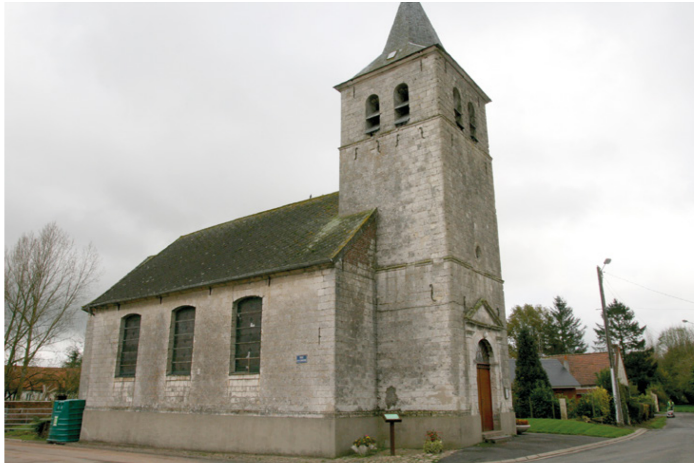
1. Vue générale de la façade nord-ouest

Canton Avesnes-le-Comte, arrondissement Arras, 165 habitants