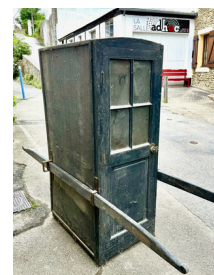
Quelques œuvres proposées aux lycéens d'Auray (56) : Le Pardon de Notre-Dame de Lotivy, Quiberon Chaise à porteurs, Le Palais La Vierge de Pitié, Lorient