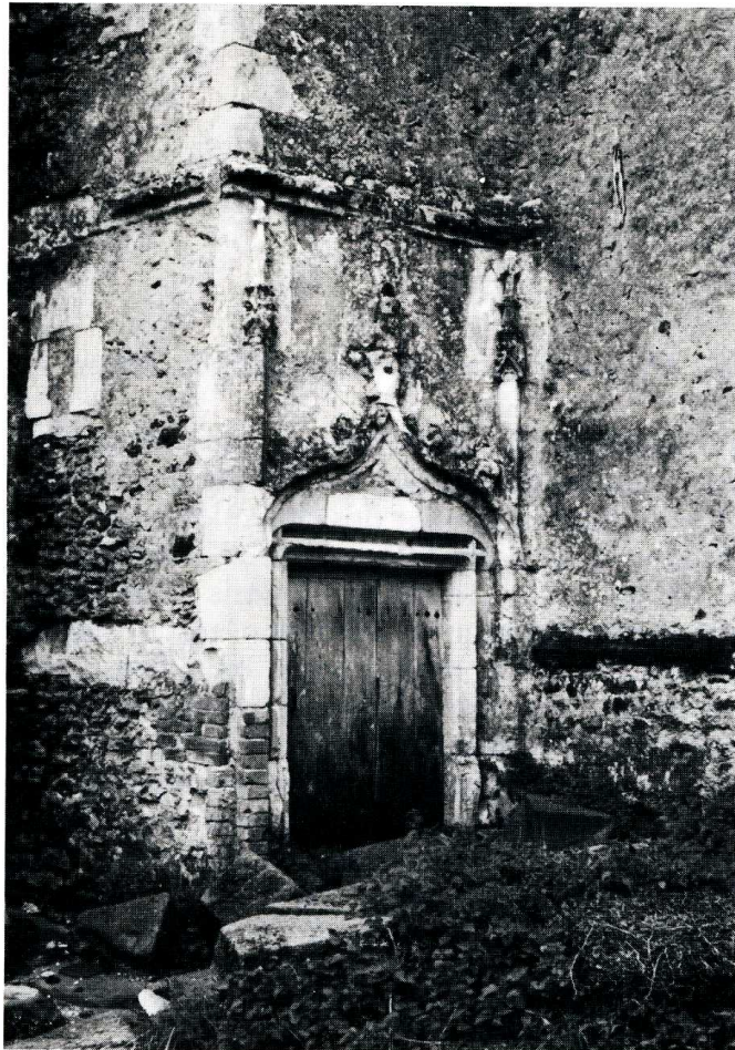
Changé (Sarthe). Chapelle de la Buzardière.