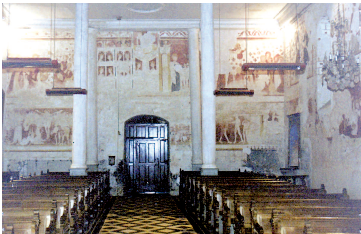
4. Revers de la façade occidentale