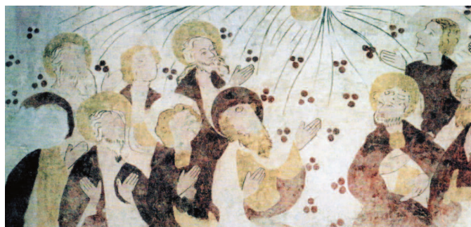
Saint-Sulpice-sur-Risle (Orne) Église Saint-Sulpice Détail d'une fresque représentant la Pentecôte

chevrons portant ferme en berceau brisé lambrissé, ornée de motifs peints du XV e ou du XVI e siècle.