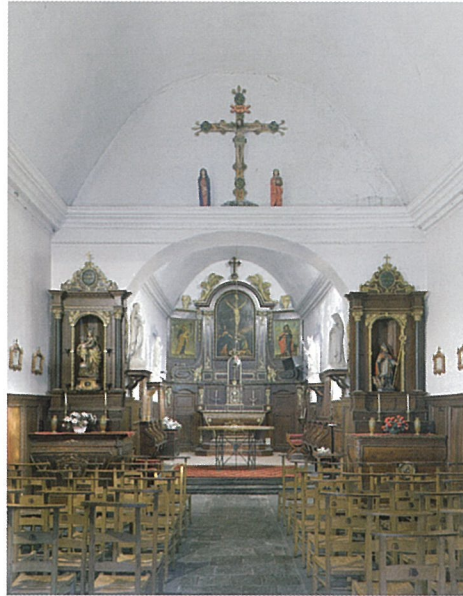
Rombries-et-Marchipont (Nord) Église Saint-Nicolas Vue intérieure vers le chœur